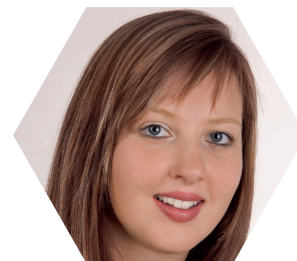
Marketenderin aus Leib und Seele