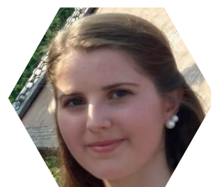
Marketenderin und Trompeterin