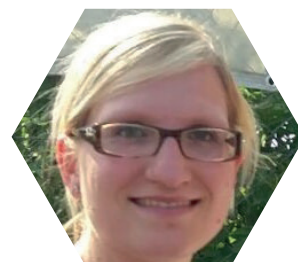
aus Babypause zurückgekehrte Marketenderin