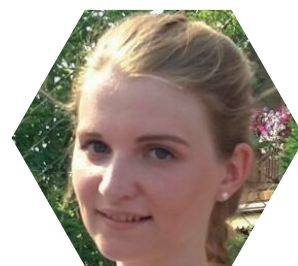
Marketenderin und Klarinetistin